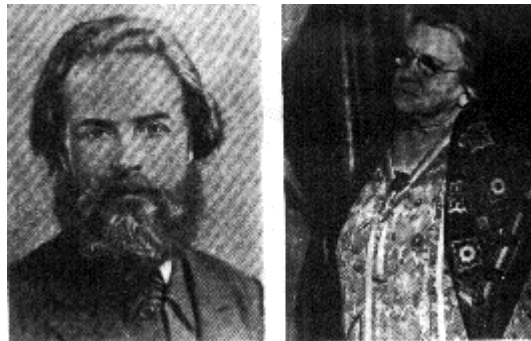
Elíseo Reclus y Emma Goldman.

Más cerca de nosotros, tampoco es desdeñable la obra realizada por Hem Day y sus cuadernos «Pensamiento y acción».