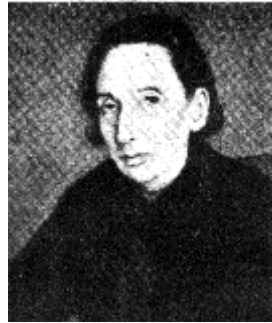
Luisa Michel, cofundadora con Sebastián Faure de «Le Libertaire»

concepción de la República por la que combatían difería mucho de lo que fue la proclamada en 1871 y que tan efímera vida tuvo.