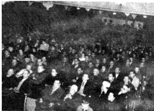
Miting de la CNT española en Marsella, en julio de 1970.

Hasta la fecha, experimentalmente, como expresión práctica y eficaz de realización colectivista-comunista viviente, puede ofrecerse el de las colectividades de tipo libertario durante la Revolución española, en una situación dada de trascendental realismo histórico, manifestándose como organismos eficientes para asegurar el desenvolvimiento económico de un pueblo, sobre todo desenvolviéndose vinculadas de concierto con los sindicatos y demás organismos comunales, complementarios unos de otros y atendiendo, cada uno en su esfera delimitada y característica respectiva, las necesidades y funciones económicas y sociales inherentes a la sociedad o comunidad.