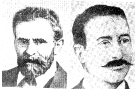
Enrique Malatesta y Pietro Gori.