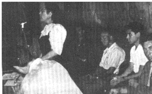
Colonia de Aymare (Francia). Intento de colectividad agrícola. 1952.

El anarquismo emergió lentamente de la terrible prueba que para él habían sido la pérdida de la guerra y de la revolución en España, los diversos avatares de esa experiencia y el paso del nazi-fascismo por una Europa devastada y dividida.