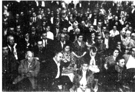
Miting de la CNT en el Palacio de los Deportes en Toulouse en 1960.

»1. Abolición de la propiedad privada de la tierra, de las materias primas y de los instrumentos de trabajo, para que nadie pueda vivir explotando el trabajo ajeno y todos, al ver garantizados los medios de producir y vivir, sean realmente independientes y puedan asociarse a los demás libremente, por el interés común y según las propias simpatías.