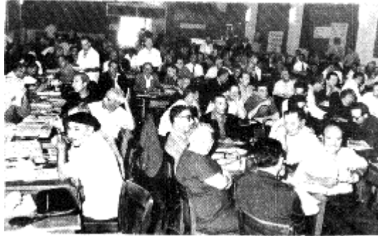
Congreso Intercontinental de la CNT de España en el exilio. 1965