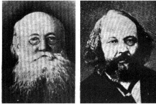
Kropotkin y Michael Bakunin.

que el tema de la organización de la vida en una sociedad liberada del Estado pensaron los anarquistas.