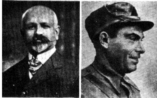
Francisco Ferrer y Guardia y Buenaventura Durruti.

Sería, no obstante, limitar la acción libertaria, si la circunscribiéramos a la simple intervención de los anarquistas en el movimiento obrero. Son centenares las revistas publicadas, los periódicos. Se suman por millares los libros y folletos editados. Desde las Escuelas laicas de Gabarro, a las Escuelas racionalistas que se multiplicaron en España en los años que van de 1915 a 1936, pasando por el ensayo heroico de Ferrer Guardia, que quiso crear una Escuela Moderna en España (ensayo que le costó la vida, ya que fue muerto fusilado por el solo crimen de haber intentado fundar una escuela liberada de la influencia religiosa en un país donde la Iglesia era todopoderosa y su criterio y sus procedimientos impregnados todavía del espíritu de la Inquisición), la labor libertaria fue múltiple, constante y lo abarcó todo, sin descuidar ningún aspecto.