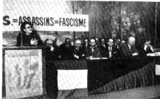
Federica Montseny en el Miting de la Alianza Sindical. París 1964.

Ella correspondía al Punto 6.º: «La organización de la economía en una sociedad anarquista, o durante la etapa de transición revolucionaria hacia la anarquía».